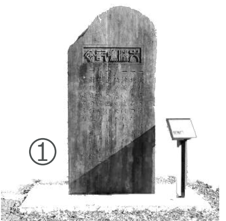
① 大海嘯記念碑 (だいかいしょうきねんひ) 昭和9年建立 田の浜 緑地公園

教訓は上記のような内容が多く、裏面には各地の被害状況の詳細が記されています(文字は表記のまま)