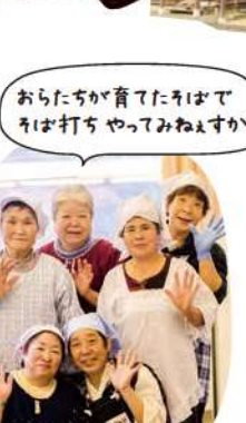
白石集落「ごっとな会」