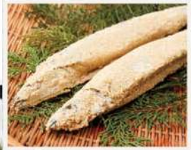
一夜干しめか漬けさんま さんまのマリネ